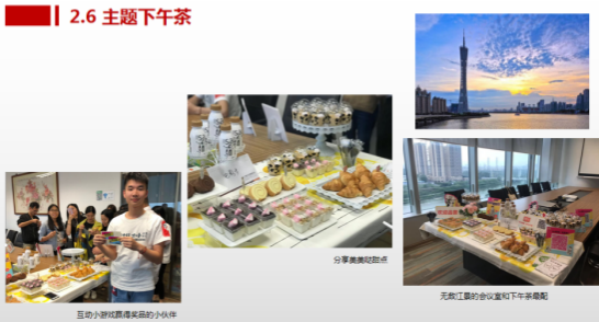
互动小游戏赢得奖品的小伙伴