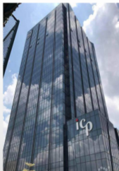
广州CBDO华南地区总部 超甲级写字楼