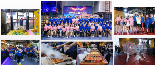
乐趣团建项目多多 美食、舞蹈、游戏、运动好戏